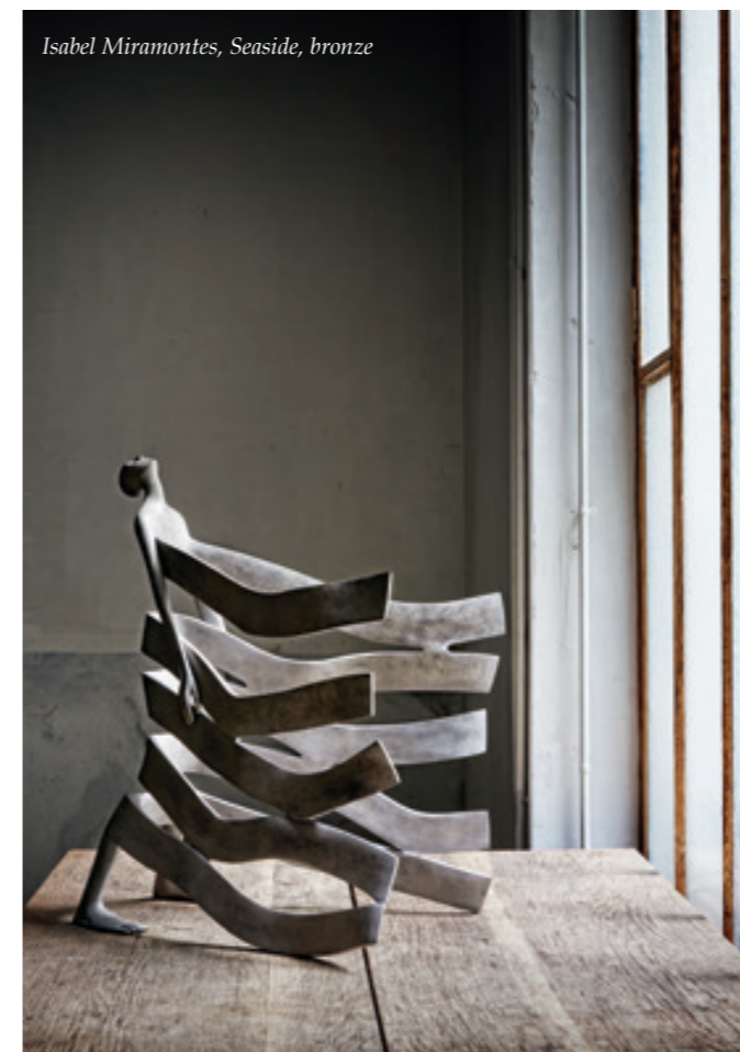
Isabel Miramontes, Seaside, bronze

Isabel Miramontes est de ces rencontres marquantes pour Gabrielle, une collaboration fructueuse qui dure depuis près de deux décennies. Originaires d'Espagne et établie en Belgique, Isabel a le talent rare de capturer l'essence de la condition humaine à travers ses sculptures. Elle navigue habilement entre les paradoxes de la force et de la fragilité, de l'entrave et de la quête de liberté.