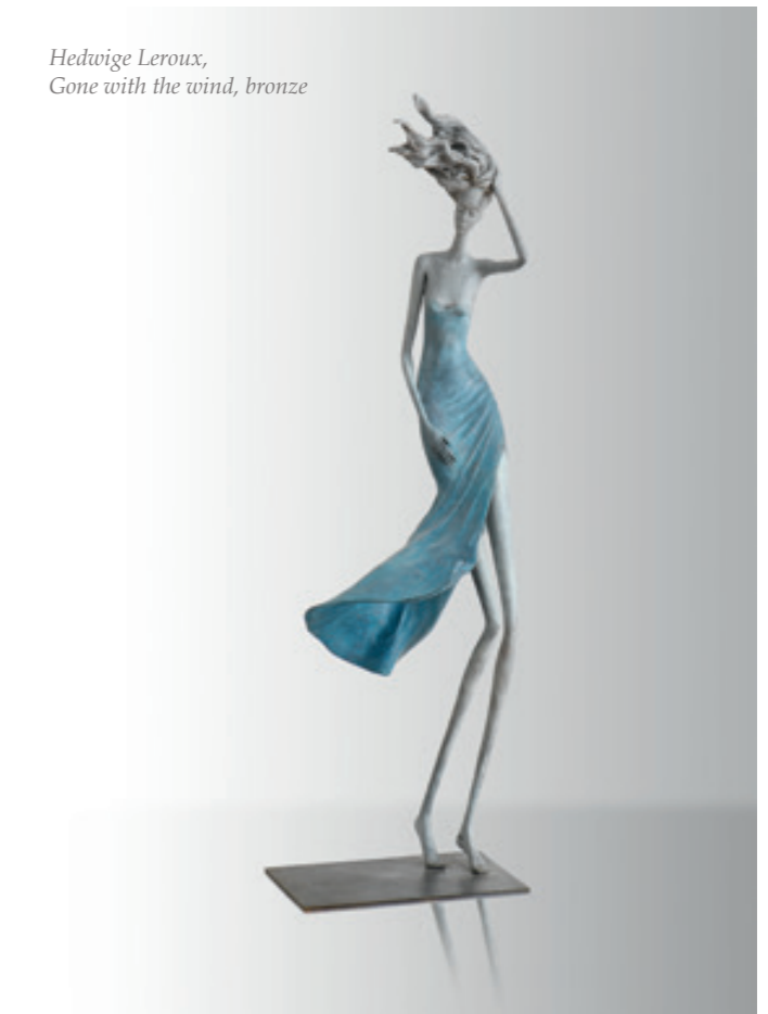
Hedwige Leroux, Gone with the wind, bronze