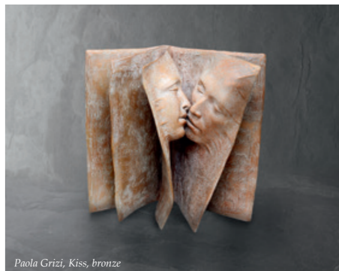
Paola Grizi, Kiss, bronze

Gabrielle, guidée par ses coups de cœur, entretient des relations quotidiennes avec ses artistes, tous unis par une passion commune pour le figuratif contemporain.